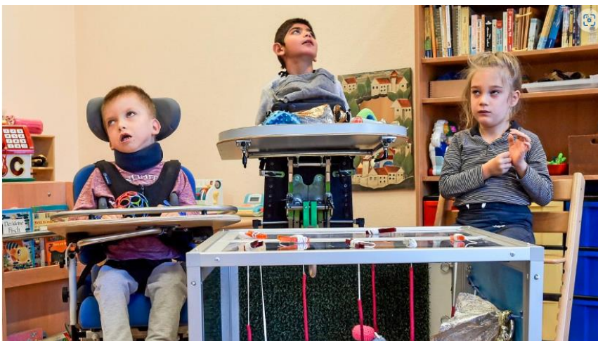
Die Kinder der Vorschulklasse mit einem neuen „Little Room“.

- Vorschulische Förderung/Frühförderung: Herr Helias hat den Kontakt zu einer Malerfirma hergestellt, die in den Winterferien 2020 den Raum der Vorschulgruppe neu streicht. Die Kosten werden von seinem Verein Together e.V. übernommen. Ebenfalls hat er den Kontakt zu Berliner Helfen e.V. der Morgenpost hergestellt. Dank einer Spende über 25.000 € wird der Vorschulraum neu eingerichtet und ausgestattet. Weiteres Material, das auch in der mobilen Frühförderung eingesetzt wird, kann angeschafft werden. Siehe auch: Wie blinde Kinder die Welt entdecken - Berliner Morgenpost