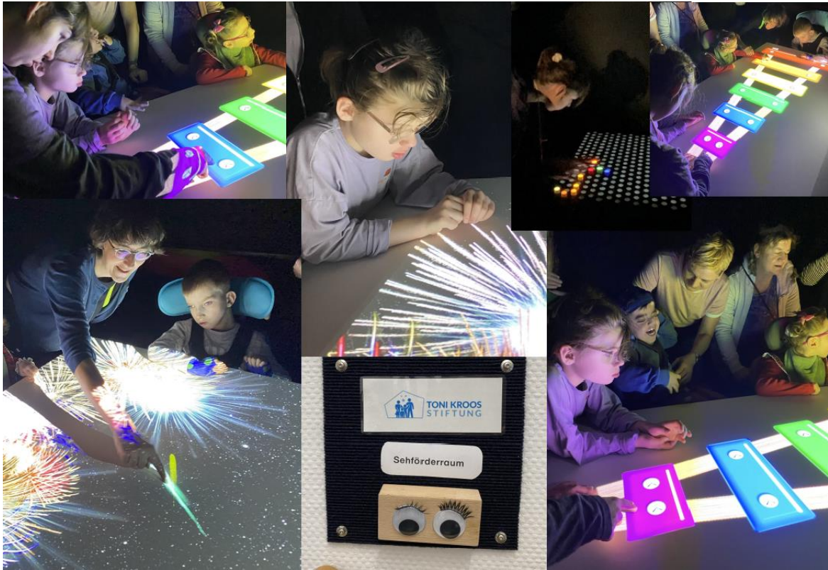
Große Begeisterung bei Klein und Groß zur Eröffnung des Sehförderraums am 09.12.2025

Mitgliederversammlungen fanden am 09.04.2025 und am 18.07.2025 in der Bibliothek der Zeune-Schule statt.